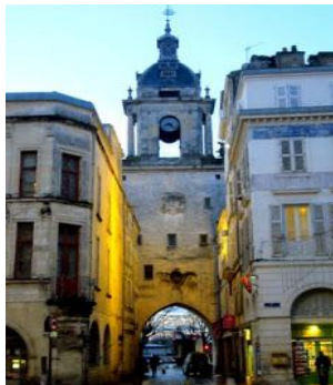
La Rochelle – La grosse horloge