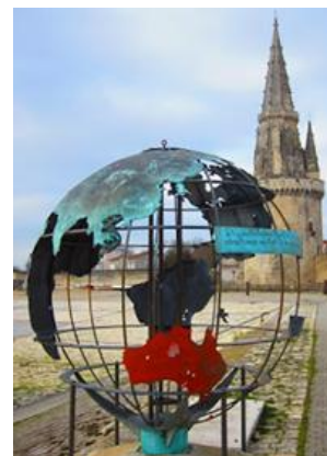
Le Globe de la Francophonie